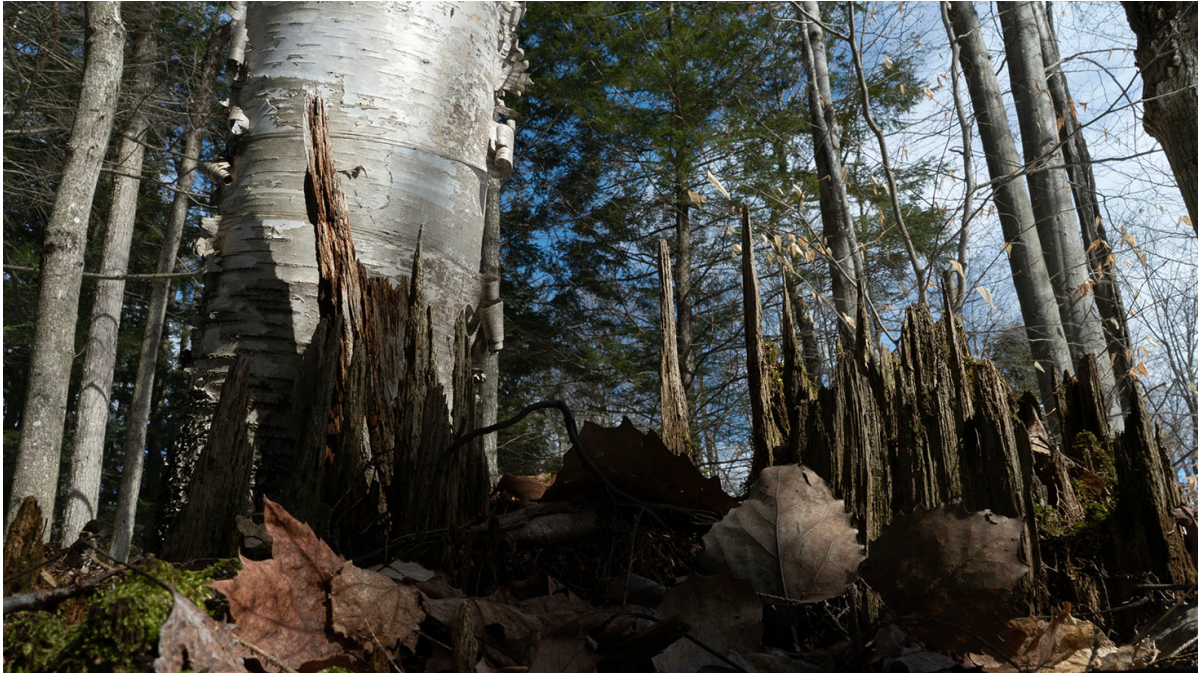
Souche. Mars 2022 à Saint-Edmond-de-Grantham.

Quand il tombe, l'arbre fait deux trous. Celui dans le ciel est le plus grand. — Félix Leclerc